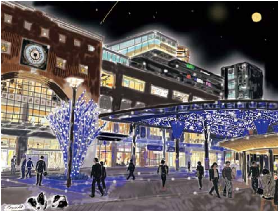
画「大分駅のイルミネーション デジ絵その2」前田 修二

R.I.テーマ 「世界に希望を生み出そう」 大分東RCスローガン 「Come together」