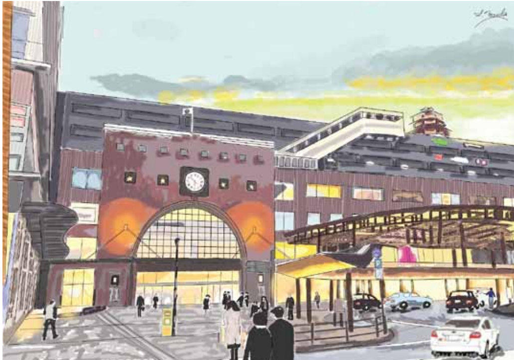
画「初めてのデジ絵で描いた大分駅」前田 修二

R.I.テーマ 「世界に希望を生み出そう」 大分東RCスローガン 「Come together」