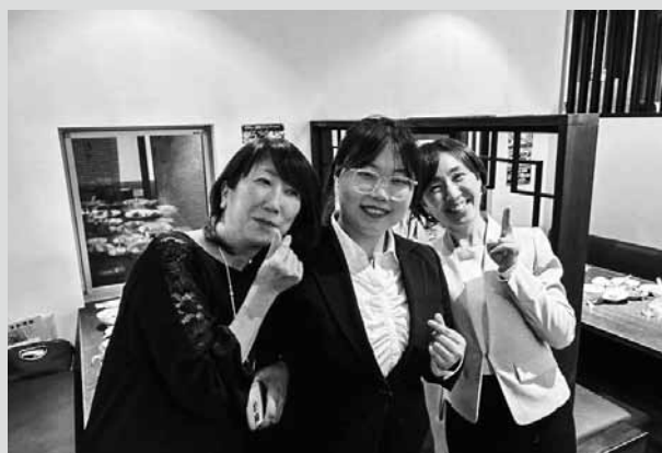
米山カウンセラーの二人と一緒に