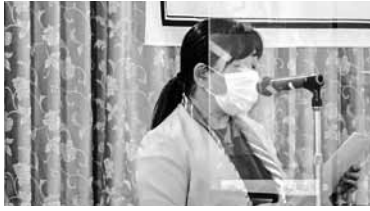
管理運営部門 本庄部門長