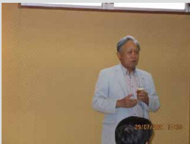
織部会員の乾杯の挨拶