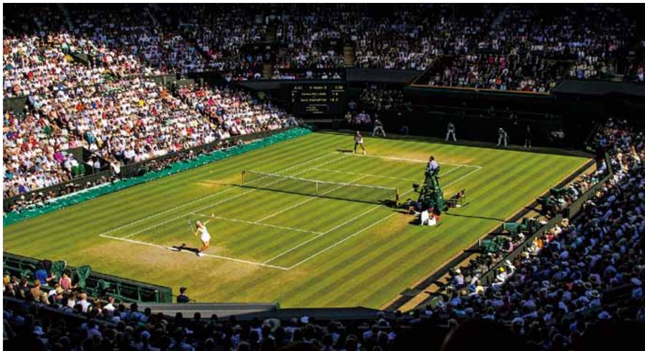
テニスの全英オープンが開催されるウィンブルドンセンターコート

R.I.テーマ 「奉仕しよう みんなの人生を豊かにするために」 大分東RCスローガン 「温故知新 新しい時代のロータリーを考えよう」