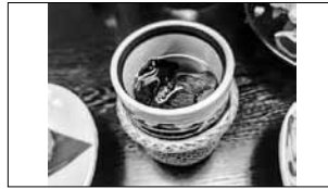
キューティートップス