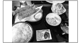
大在 ホテルトバース