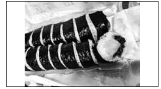
野田商店「巻きずし」