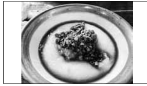
甘味茶屋「つきもち」