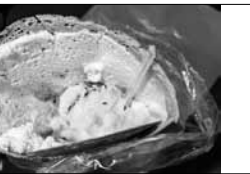
キューティートップス