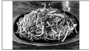
みくま飯店「日田焼きそば」