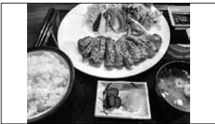
大在 ホテルトバース